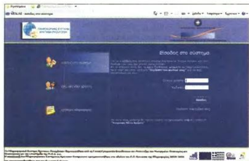
Η υποβολή των προτάσεων θα γίνεται αποκλειστικά μέσω της ιστοσελίδας www.ependyseis.gr/mis .

Ναι, για την υποβολή της αίτησης θα πρέπει να υπάρχει το σχετικό παραστατικό προσφοράς ή προτιμολόγιο, τα στοιχεία του οποίου πρέπει να εισαχθούν στη σχετική φόρμα ηλεκτρονικής υποβολής