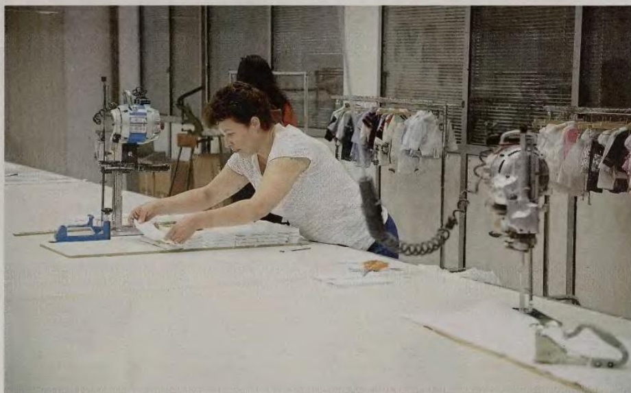
Στόχος του προγράμματος «Πράσινη Επιχείρηση» είναι η μείωση του ενεργειακού και κυρίως του περιβαλλοντικού αποτυπώματος του μεταποιητικού κλάδου.

νόμιμου εκπροσώπου της επιχείρησης που να βεβαιώνει ότι: α) Οι δαπάνες του προτεινόμενου έργου δεν έχουν χρηματοδοτηθεί και δεν έχουν ενταχθεί σε άλλο πρόγραμμα που χρηματοδοτείται από εθνικούς ή κοινοτικούς πόρους. Η προϋπόθεση αυτή αφορά τόσο το σύνολο του έργου όσο και τις επιμέρους ενέργειες. β) Δεν έγινε έναρξη του έργου πριν από την ημερομηνία προδημοσίευσης του προγράμματος (ως έναρξη του έργου θεωρείται και η ανάληψη νομικής δέσμευσης για οποιαδήποτε από τις επιλέξιμες κατηγορίες δαπανών).